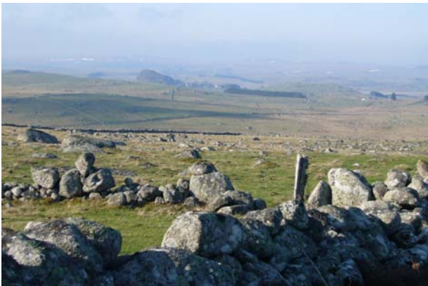
Auf dem Jakobsweg durch eine wildromantische Gegend