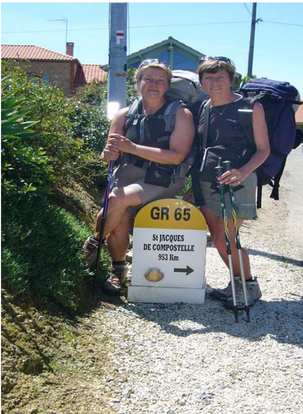
Nicht mehr ganz 1000 Kilometer bis Compostela

Das war ein sehr langer und harter Tag. Es war heiss und ich musste viel auf Asphalt und Schotterstrassen wandern. Meine Füsse taten höllisch weh. Offenbar hatte ich sie überstrapaziert. Vielleicht eine Sehnenentzündung oder so etwas.