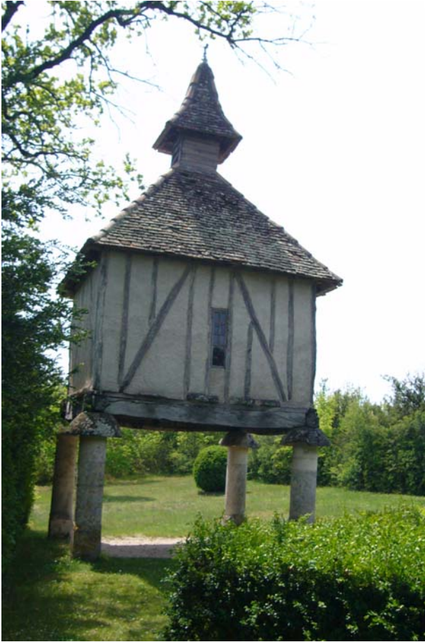
Das so genannte Taubenhaus bei Le Chartron