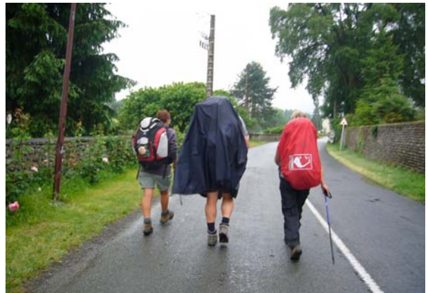
Marsch im Regen . . .

Ich spürte, dass ich so langsam aber sicher genug hatte von diesem Gîteleben. Und trotzdem fand ich es auf der