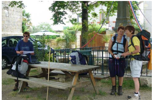
Rast in Flamarens

Ich wollte, wie die anderen den kürzeren Weg nach Condom nehmen, hatte aber irgendwie etwas falsch gemacht und lief die viel längere Route über Romieux. Da mir meine Füße wiederum Probleme bereiteten und