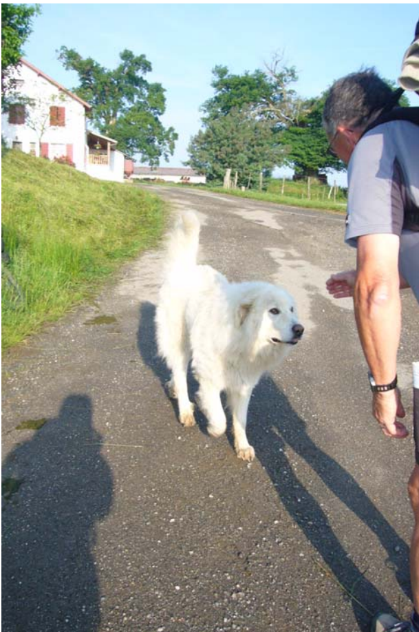
Nicht alle Hunde waren so freundlich, wie dieser Baske