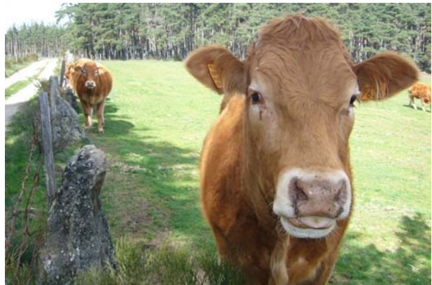
Die braunen Aubrac-Kühe mit den sanften Augen