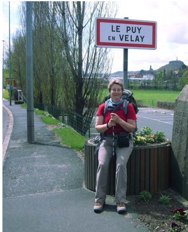
Geschafft! Das erste Ziel ist erreicht

Bei der Rückkehr in die Gîte waren ungewohnt viele Franzosen beim Nachtessen. Die wollen alle morgen auf den Weg!!! Zum essen gab es die in dieser Gegend berühmten grünen Linsen (Lentille Verte du Puy), die schmeckten mir ausgezeichnet. Mit vollem Bauch verzog ich mich gleich ins Zimmer, das ich mit einer etwa 70jährigen Frau aus der Normandie teilte. Sie startet von hier aus ihre Pilgerreise nach Rom. Am morgen wollen wir zusammen in die berühmte Kathedrale zur Pilgermesse, was allerdings bedeutet, dass wir früh aus den Federn müssen.