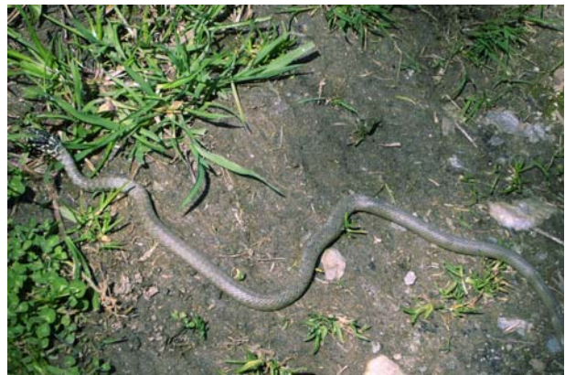
Begegnung mit einer Schlange

Dieser Tag fing nicht so gut an. Ich fühlte mich überhaupt nicht ausgeruht. Geärgert hatte ich mich über den hohen Preis den ich für die Übernachtung bezahlen musste. So machte ich mich ein bisschen frustriert auf die Socken. Die Wegführung war zum Teil recht steil und anstrengend, führte aber zuerst lange am Fluss Lot entlang. Viel Asphalt. Dies gefiel meinen Füßen gar nicht. Nach ein