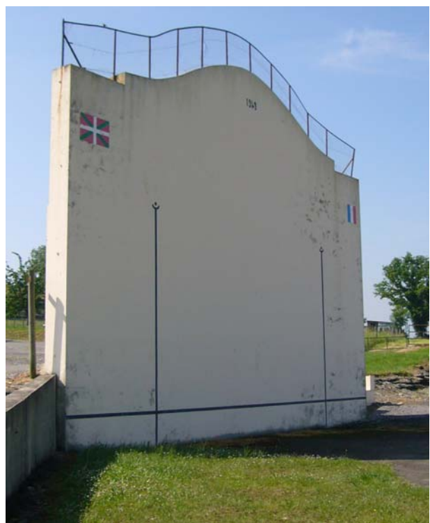
Fast jeder Ort hat einen Fonton