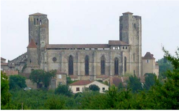
Die Stiftskirche Saint-Pierre in Romieu