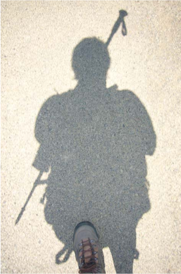
Mein treuester Begleiter!