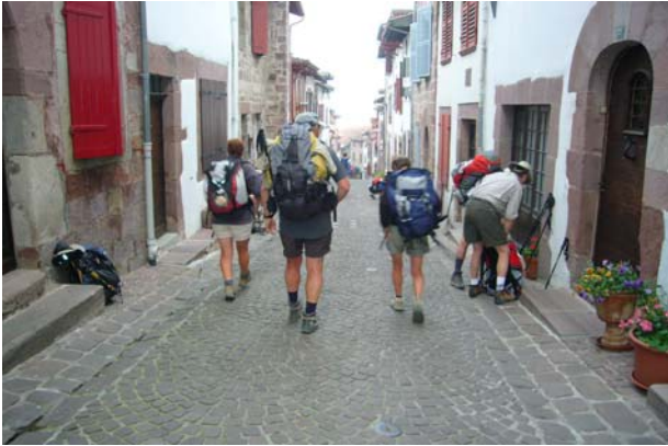
Wehmütiger Augenblick: Meine Freunde ziehen weiter

Auf dem Pilgerbüro holte ich meinen Stempel und nahm auch gleich Informationsmaterial für den Weg durch Spanien mit.