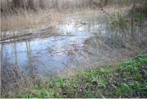
Dies wäre eigentlich der Weg!