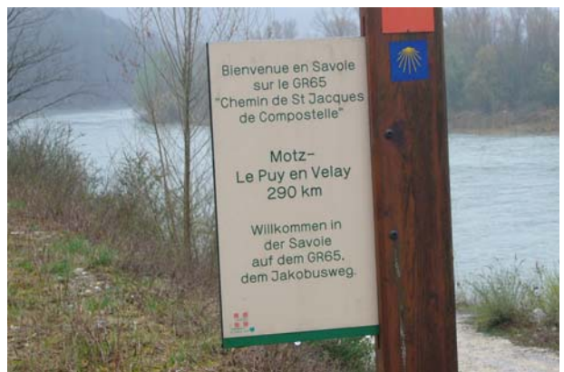
Erster Blick auf die Rhone