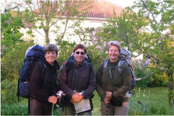
Bereit für einen neuen Tag