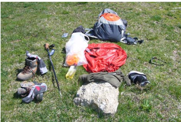
Stilleben meiner Rast am Mittag