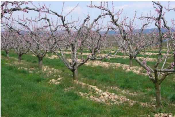
Die ersten blühenden Bäume, am 11. April