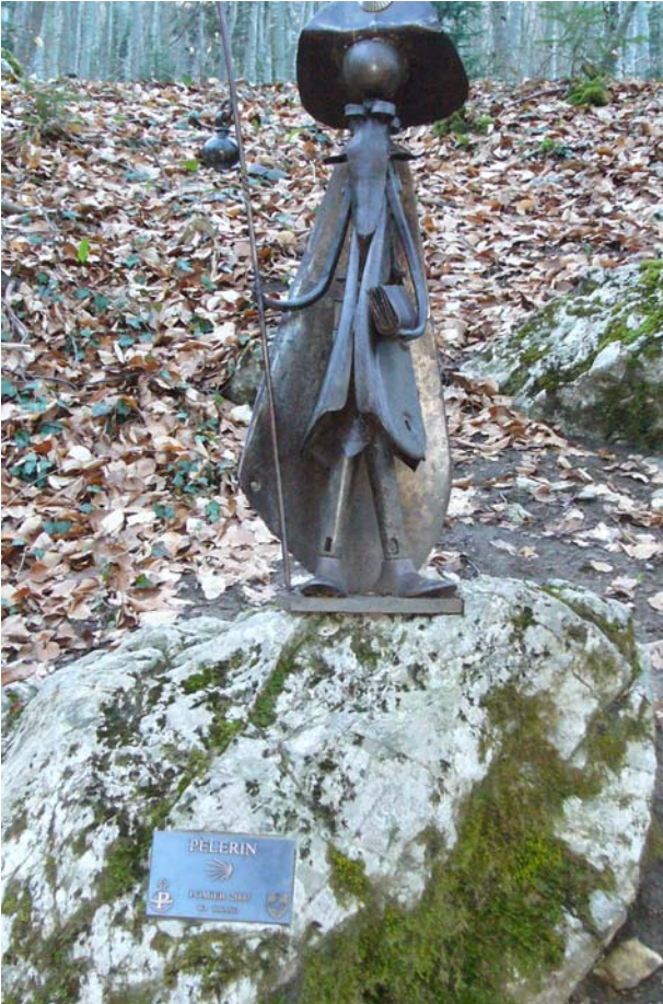
Jakobsfigur im Wald nach Beaumont

Heute Morgen marschierte ich um halb neun Uhr los, durch den Morgentau der Sonne entgegen. Durch Wälder und Weiden. Auf der rechten Seite das Tal und die noch schneebedeckten Berge. Es ging über eine Hochebene des Salève, vorbei an Bauernhäusern und kleinen Weilern. Kilometerweit wanderte ich bis ich wieder auf ein menschliches Wesen traf. Meist waren es Bauern auf dem Traktor am Güllen. Ich fühlte mich super. Auch der Schmerz im Oberschenkel machte sich nicht wieder bemerkbar.