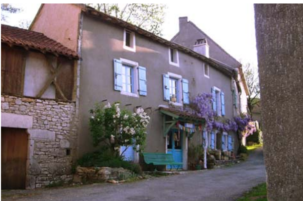
Les Volets bleu