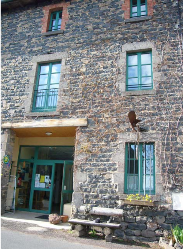
Gîte in Privat d'Allier