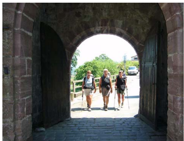
Geschafft! Das Stadttor von Saint-Jean-Pied-de-Port