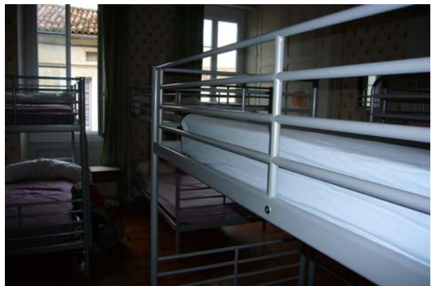
Batteriehaltung in der Gîte von Lectoure