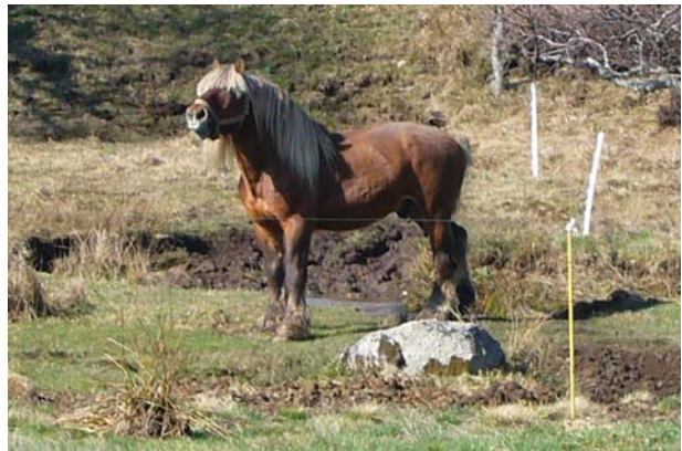
In dieser Gegend begegnet man oft Pferden