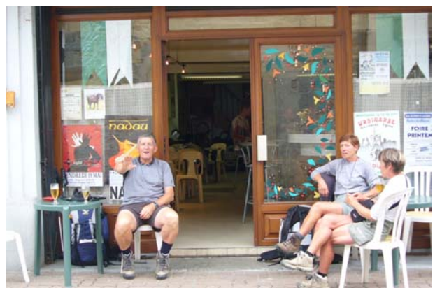
Ein Bierechen zum Abschluss der Etappe