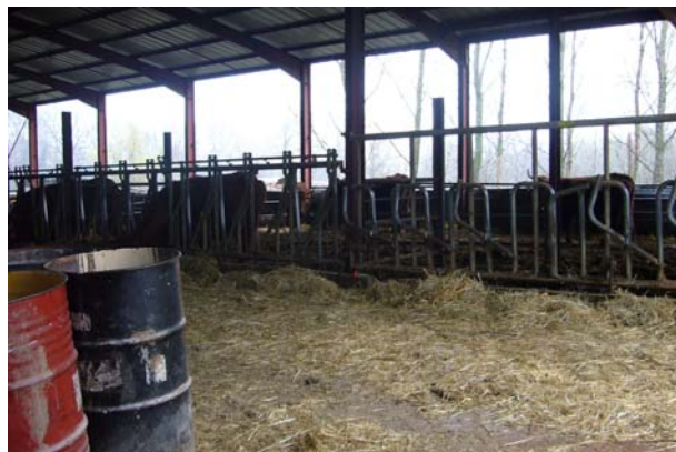
Der einzige trockene Platz zum Picknicken war dieser Kuhstall

Wir drei Pilger verbrachten zusammen einen sehr gemütlichen Abend. Ich mag diese zwei Männer sehr. Sie sind sehr höflich und aufmerksam.