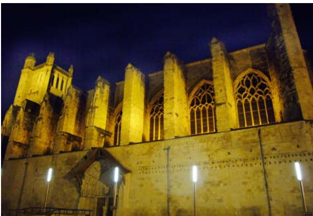
Kathedrale Saint-Pierre in Condom