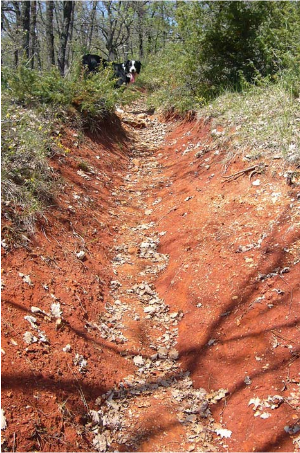
Der Hund der Gîte „Le Pech“ führte mich durch diesen roten Weg hinauf zur Herberge

Wie man uns sagte, würden diese Autotouristen langsam zum Problem, weil sie den echten Pilgern die Schlafplätze streitig machten. Man hätte keine Kontrolle, wenn jemand spät eintreffe, weil die Gîte Communales von Freiwilligen geführt würden, die nur kommen um die Leute zu registrieren und dann wieder gehen.