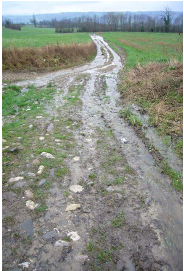
Mehr Bach als Weg: Der Jakobsweg kurz nach Frangy

Gesprochen hatte ich fast den ganzen Tag nicht. Ich begegnete ja fast niemandem bis am späteren Nachmittag. Die zwei Pilger von gestern habe ich wieder gesehen und mit einem Bauern habe ich ein paar Worte gewechselt. Er sagte zu mir „On se promene“? Dies fand ich witzig, nach fünf Stunden anstrengendem wandern.