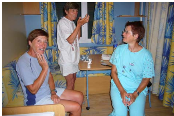
. . . und im Wohnwagen auf dem Campingplatz

Bin um halb acht losgelaufen und abends um halb sechs angekommen.