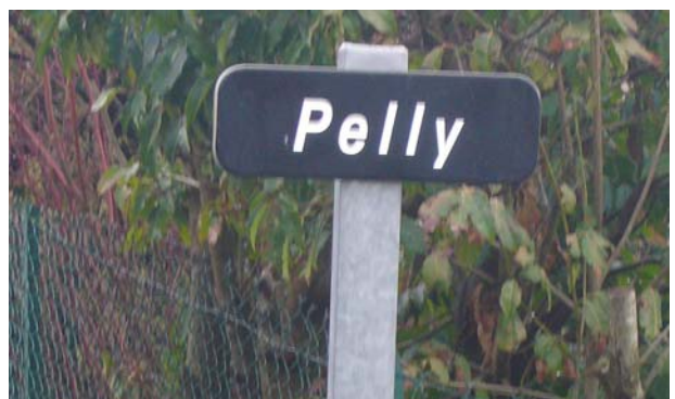
Bin ich hier zu Hause - oder was?