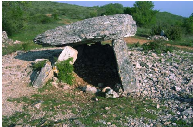
Dolmen, vermutlich Grabkammern aus vorkeltischer Kultur

Um Mitternacht ist eine Gruppe Verrückter mit Autos angekommen und hat im Zimmer nebenan Lärm gemacht, als wären sie alleine auf der Welt. Die ärgerten uns und wir klopfen gegen die Wand und schimpften. Am morgen um sechs Uhr brausten sie wieder mit lautem Krach davon.