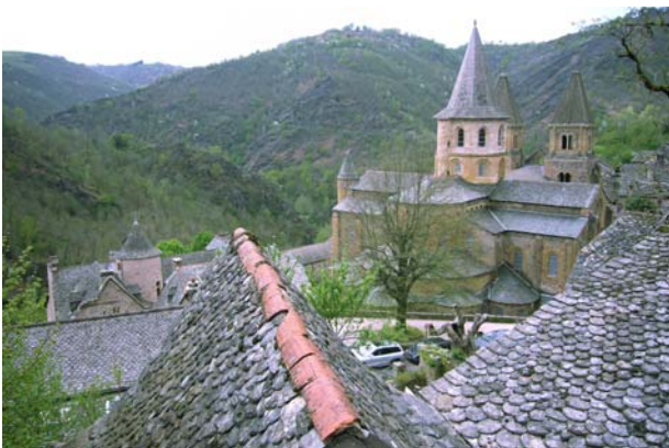
Conques, eingebettet in eine raue Hügellandschaft