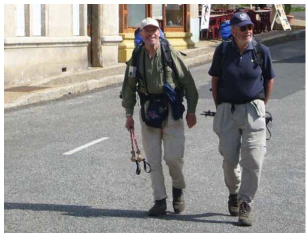
Grosse Freude, meine beiden Brüder wieder zu sehen . . .