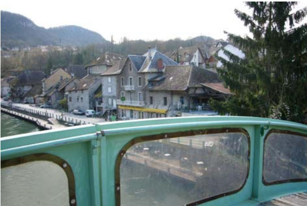
Blick von der Brücke auf das Städtchen Chanaz