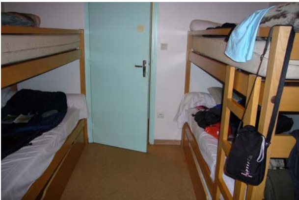
Klein aber männerfrei!