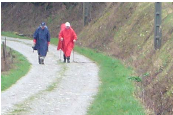
Begegnung mit den zwei ersten Pilgern

Ich musste meine Regenkleider anziehen, da es am Morgen noch leicht regnete. Von Frangy ging ich hoch hinauf, auf