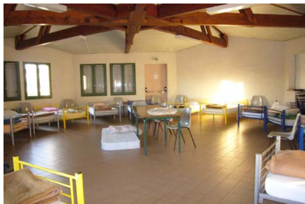
Rund, aber nicht wirklich gemütlich