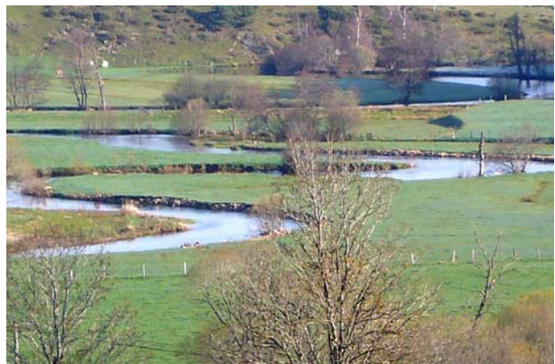
Meandrierendes Flüssejen bei Les Estrets