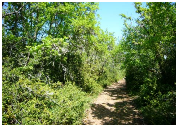
Lange führt der Weg durch diesen Eichenwald