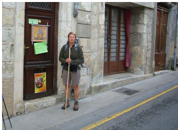
Ich und mein Pilgerstab vor dem Start in Lectoure