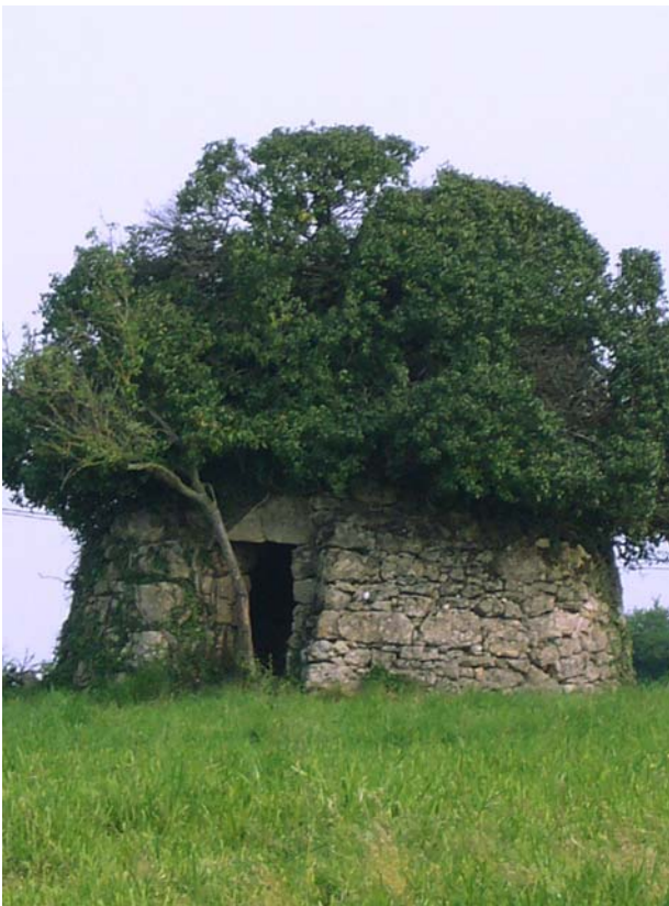
Eines der typischen „cazelles“