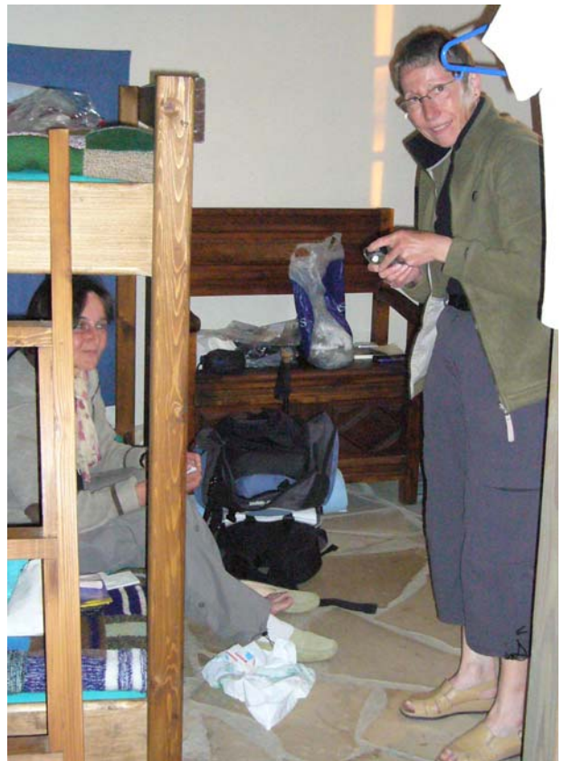
Zimmergenossinnen beim Verarzten wunder Füße

Also ging ich dafür in ein kleines Restaurant und ass ein Entrecote mit Pommes und Salat. War das fein! Ich wollte schon zurück in die Gîte, als mir die anderen, die selber gekocht hatten, entgegen kamen. Da machte ich mit Ihnen noch einmal eine Runde durch die Strassen, war danach aber total übermüdet und konnte vor lauter Müdigkeit fast nicht schlafen.