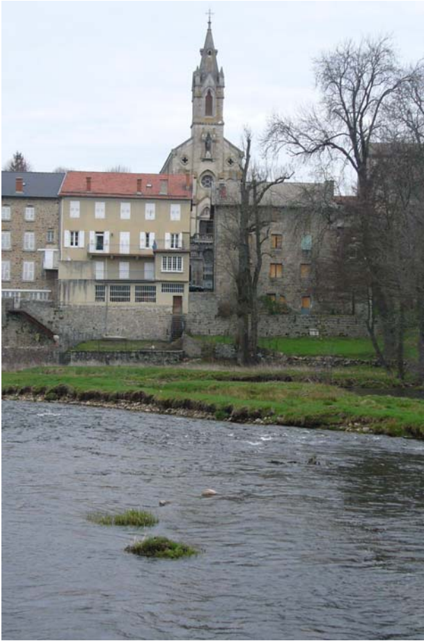
Die Kirche von Tence