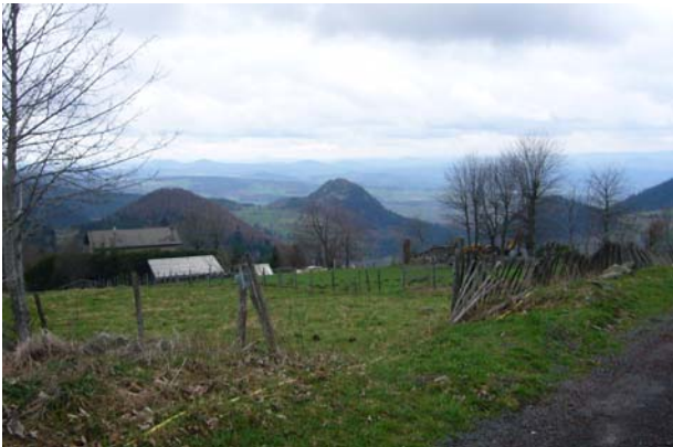
Die ersten Hügel des Velays