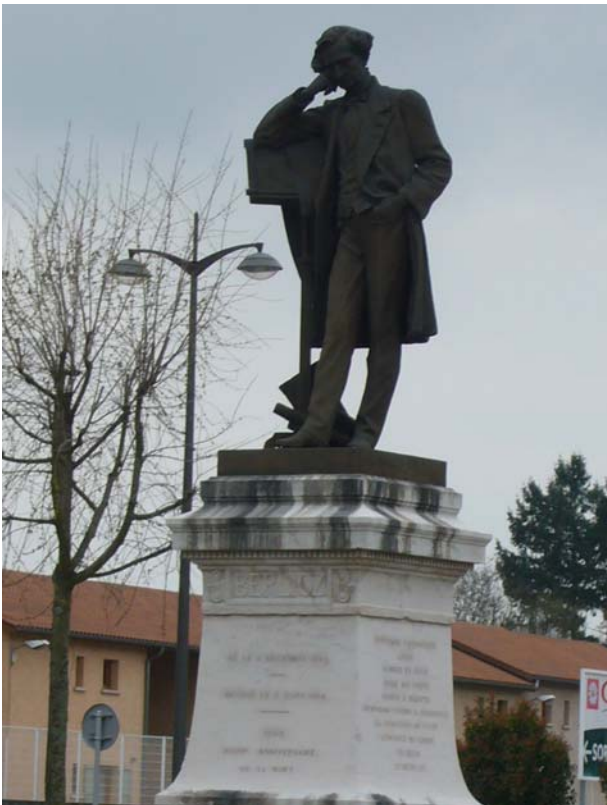
Das Denkmal von Hector Berlioz in Côte-St. André, seinem Geburtsort

Kilometer weiter nach Le Pin. Wegen dem schönen Wetter arbeiteten viele Leute in ihren Gärten. Besonders die Männer mit Ihren Rasenmähern sind mir aufgefallen. Jeder sitzt auf so einem Ding und mäht damit gemütlich den Rasen. Und immer wieder, bonne Route, vous êtes courageuse etc. Ca fait du bien!