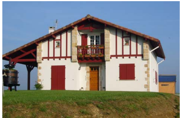
It's a long Way . . .