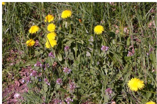
Erster Löwenzahn - oder in Französisch „pissenlit“