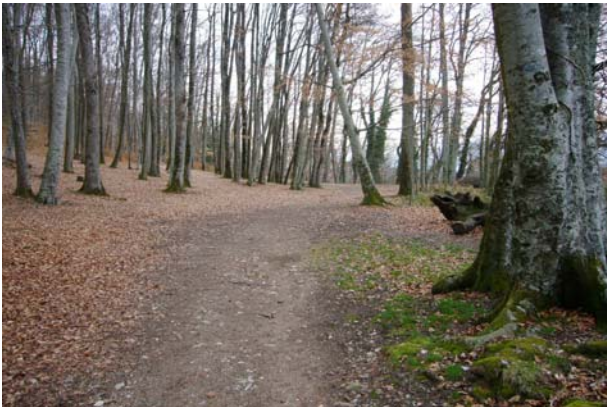
Wunderschöner Weg durch einen Laubwald