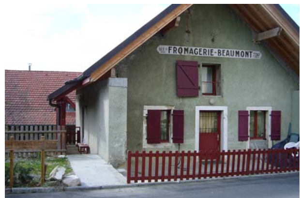
Hier übernachtete ich nach meinem ersten Tag auf dem Jakobsweg