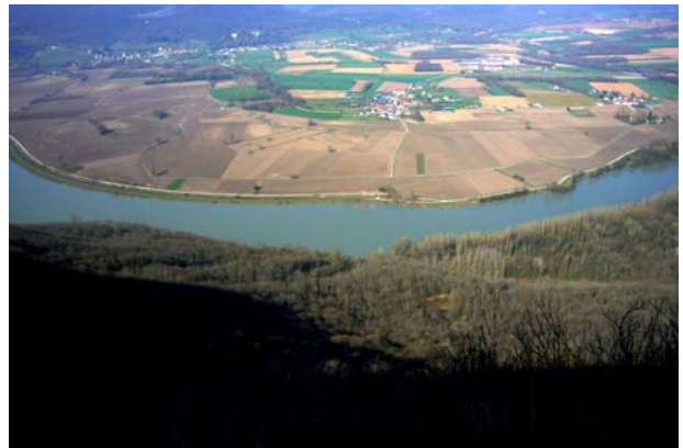
Blick auf die Rhone, hoch über Yenne