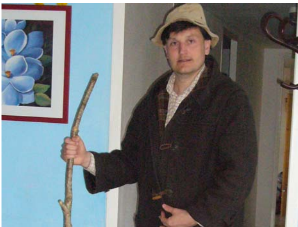
Die ersten Charolais-Rinder