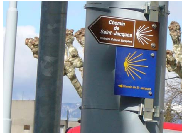
Das war der allererste Wegweiser, den ich zu Gesicht bekam - er steht in Genf