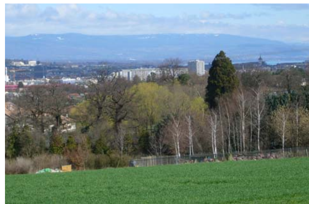
Langsam verschwand die Stadt Genf aus meinem Blickfeld